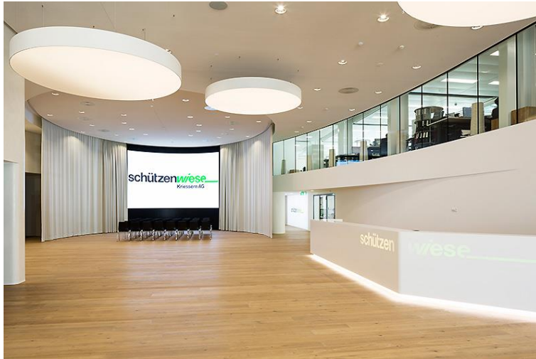
Empfang – Foyer

Platz für bis zu 150 Personen (Multimedialeinwand)